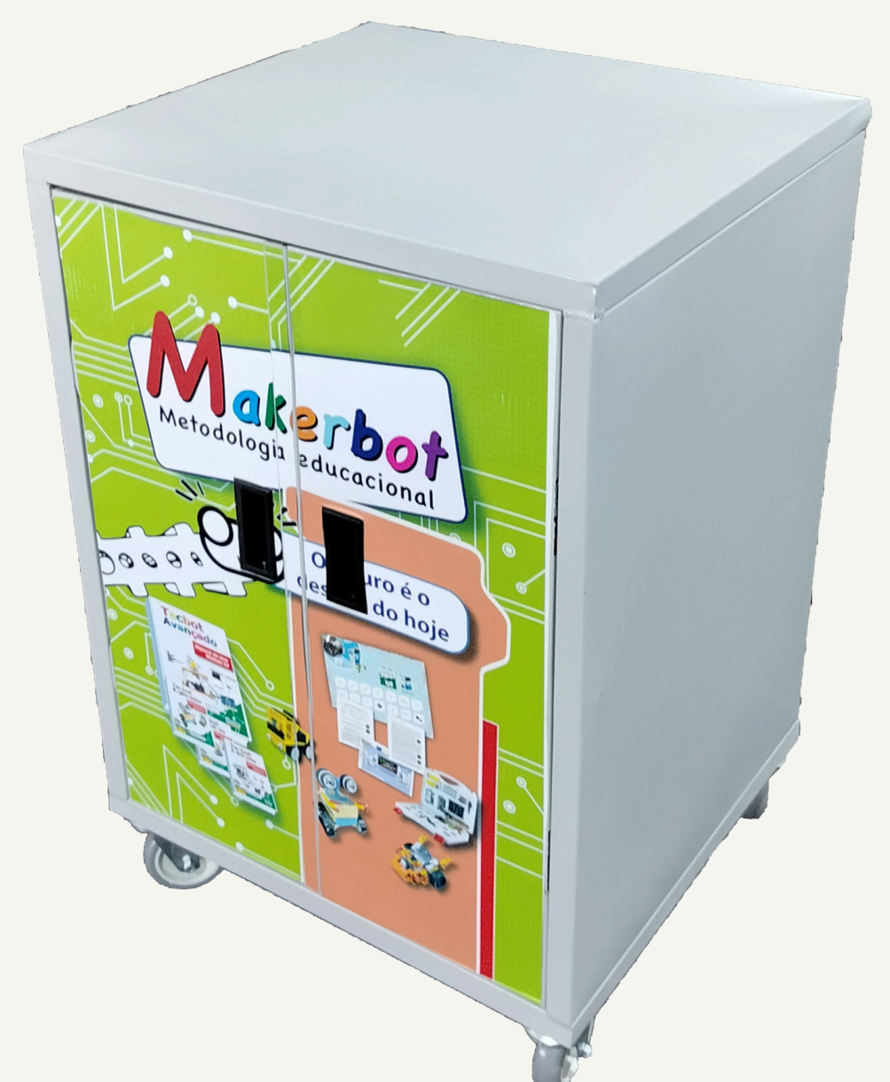
Móvel volante para armazenamento e transporte da coleção.