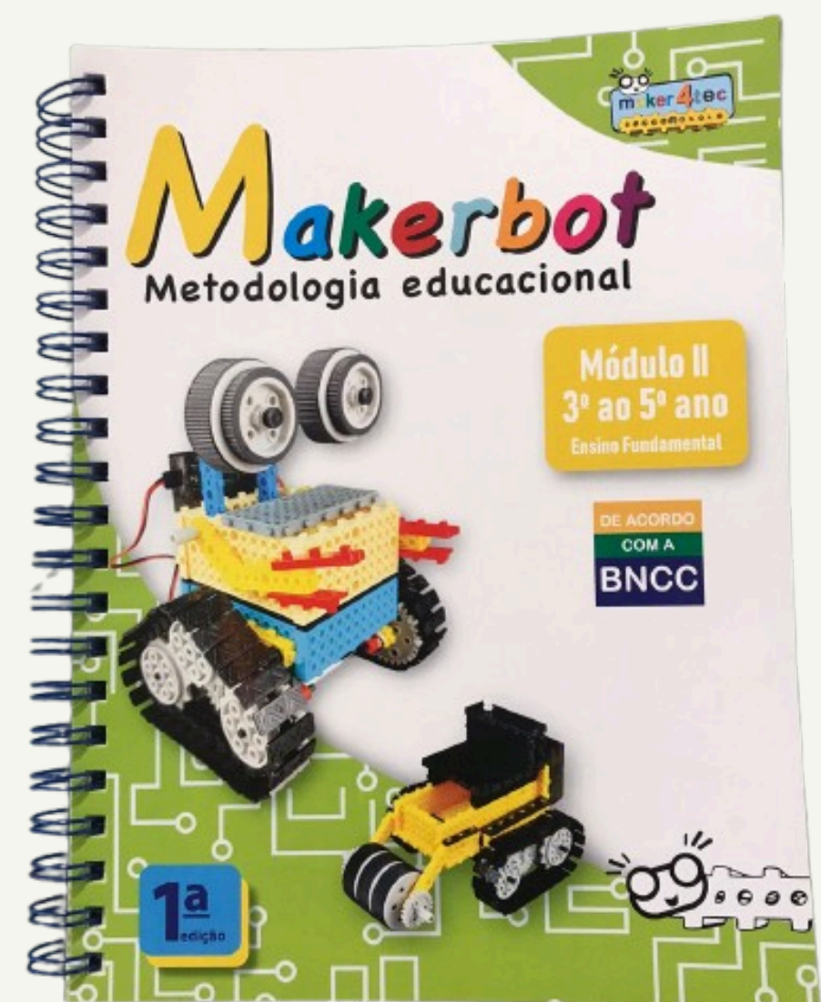
Livro de sequências didáticas.